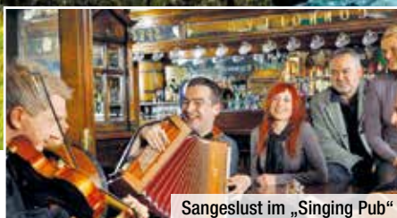
Sangeslust im „Singing Pub“

Malerische Landschaften, uralte Schlösser und gastfreundliche Inselbewohner. Entdecken Sie auf dieser 7-tägigen Rundreise mit Flug und Bus die schönsten Seiten Irlands. Erleben Sie die legendäre Hauptstadt Dublin bei einer Stadtrundfahrt, erkunden Sie Ennis, Cork und Limerick und lassen Sie sich von den wildromantischen Cliffs of Moher verzaubern. Zudem genießen Sie an zwei musikalischen Abenden die Geselligkeit und Fröhlichkeit der Iren. trendtours heißt Sie auf der „grünen Insel“ willkommen.