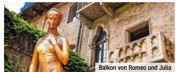
Balkon von Romeo und Julia

Reisetermine 2022: (Ermitteln Sie mit der 1. Stelle Ihrer Postleitzahl Ihren Reisettermin)