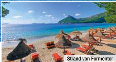
Strand von Formentor

Ausflugspaket im Wert von € 349 sowie großes Genusspaket und trendtours-Finca-Fest