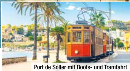
Port de Sóller mit Boots- und Tramfahrt

So viele Schönheiten, so viele tolle Erlebnisse, so viel Geselligkeit – dieses einzigartige Programm überrascht und begeistert Mallorca-„Neulinge“ ebenso wie echte Insel-Kenner. Sie wohnen mit Halbpension Plus im beliebten Badeort Paguera , genießen entspannte freie Tage und erleben ein unglaubliches Inklusiv-Programm voller Insel-Klassiker, echter Geheimtipps und kulinarischer Events. Freuen Sie sich auf vier Ganztagesausflüge , zwei Halbtagesausflüge und ein trendtours-Finca-Fest . Erleben Sie Mallorca, wie Sie es noch nie gesehen haben!