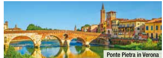
Ponte Pietra in Verona

Nicht inklusive: Die City Tax von ca. € 1,50 - 2,50 pro Person und Nacht ist vor Ort im Hotel zu entrichten. (Stand: Dezember 2021)