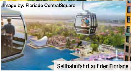
Seilbahnfahrt auf der Floriade