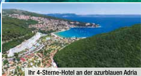
Ihr 4-Sterne-Hotel an der azurblauen Adria