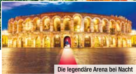
Die legendäre Arena bei Nacht

Eintrittskarte zur Opernaufführung in der Arena di Verona