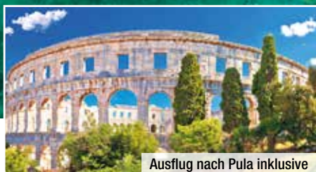
Ausflug nach Pula inklusive