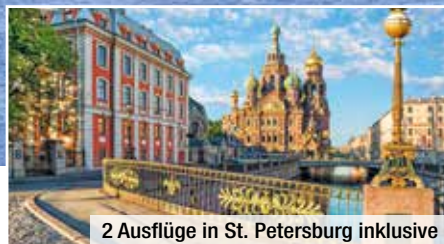
2 Ausflüge in St. Petersburg inklusive

Diese Reise lässt Sie die schönsten Seiten von Mütterchen Russland zur Sommerzeit erleben – freuen Sie sich auf eine Kombination aus entspannter Flusskreuzfahrt und spannenden Entdeckungen in Moskau und St. Petersburg! In beiden Metropolen wohnen Sie mit Halbpension in komfortablen Stadthotels und gehen auf inkludierte Stadtbesichtigungen. Je nach Reiseternin beginnt Ihr russisches Sommermärchen in Moskau oder in St. Petersburg. Auf einem Schiff der renommierten Reederei Vodohod genießen Sie die Reise zwischen den beiden Traumstädten und werden an Bord mit Vollpension verwöhnt. Sie passieren rustikale Dörferchen, unberührte Naturparadiese und goldene Kirchenkuppeln. Auf drei inklusiven Landausflügen erleben Sie darüber hinaus ausgewählte Höhepunkte des Zarenreiches – die romantische Schönheit Russlands wird Ihre Seele berühren!