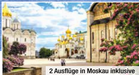
2 Ausflüge in Moskau inklusive

Vollpension an Bord, Erlebnispaket mit 3 Ausflügen während der Flusskreuzfahrt