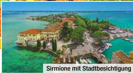
Sirmione mit Stadtbesichtigung

Die Region um den Lago di Garda mit Verona und dem Trentino, der südlichsten Alpenregion , zählt zu den schönsten Landschaften Italiens. Ein großes Ausflugsprogramm führt Sie in den malerischen Ort Sirmione , die „Perle des südlichen Gardasees“. Als weiteren Höhepunkt erleben Sie eine Stadtbesichtigung im UNESCO-Welterbe von Verona . Ein Erlebnis der besonderen Art sind die Opernfestspiele von Verona in der berühmten römischen Arena , für die wir Ihnen bereits eine Eintrittskarte reserviert haben. Sie wohnen 4 Nächte in einem ausgewählten Mittelklassehotel im Raum Gardasee oder im Trentiner Land und neben dem täglichen Frühstück gehören auch 3 Abendessen im Hotel zu Ihrem Inklusiv-Paket!