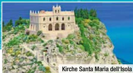
Kirche Santa Maria dell'Isola

Auf Ihrer 8-tägigen Flugreise nach Kalabrien werden Sie mit einem umfangreichen Erlebnis- und Genusspaket verwöhnt. In ausgewählten Hotels genießen Sie die Halbpension und entdecken auf Ihrem Ausflugsprogramm die malerischen Küstenstädte Tropea, Pizzo, Nicotera und das Höhlendorf Zungri . Genießen Sie zahlreiche Spezialitätenverkostungen u. a. von Limoncello, der Streichsalami Nduja, Wein, Pilz-Bruschetta, Olivenöl und Produkten der berühmten roten Zwiebel von Tropea.