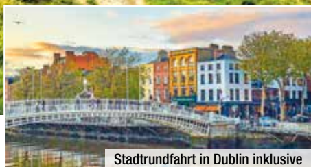
Stadtrundfahrt in Dublin inklusive

Dublin, Cliffs of Moher, Kilkenny, Limerick u. v. m.